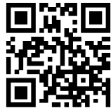
МАУ «Ирбитская ярмарка»